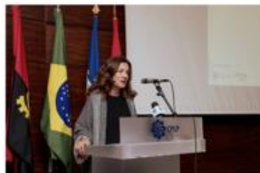
A Comissão para a Cidadania e a Igualdade de Género é uma das entidades signatárias do manifesto Mulheres pelo Clima.

CIG assina Manifesto Mulheres pelo Clima